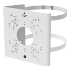
DWC-SDS-9 Крепление на шест